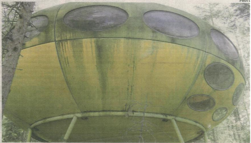
Luonnon armoilla. Tältä avaruustalon ulkopinta näytti ennen kunnostusta.

Elementit saatiin tienvarteen lopulta nelivetomönkijän avulla. Muovilevyä tehtiin kuljetuslevy, jota mönkijä saattoi vetää perässään. Maaston huonoihin kohtiin vietiin vaneria kulku-